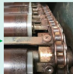
TLH 链条 - 66个月后